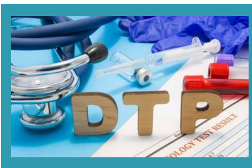
VAKSIN DPT (DIFTERI, PERTUSIS, TETANUS)