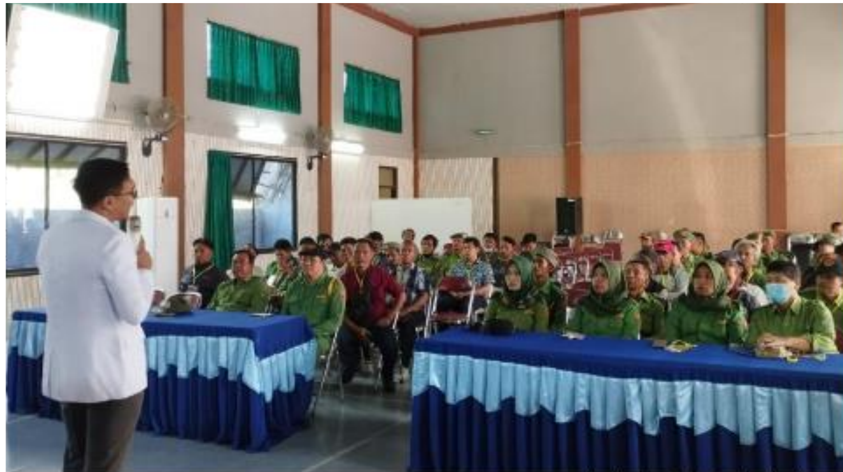
JELITA (Jejaring Lintas Sektor) RSUD Kota Salatiga bersama Satpol PP Kota Salatiga