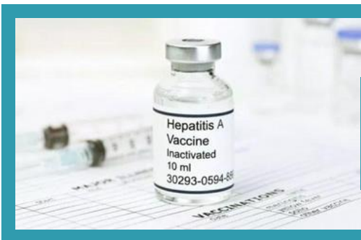
VAKSIN HEPATITIS B